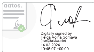
Helga Volha Somava